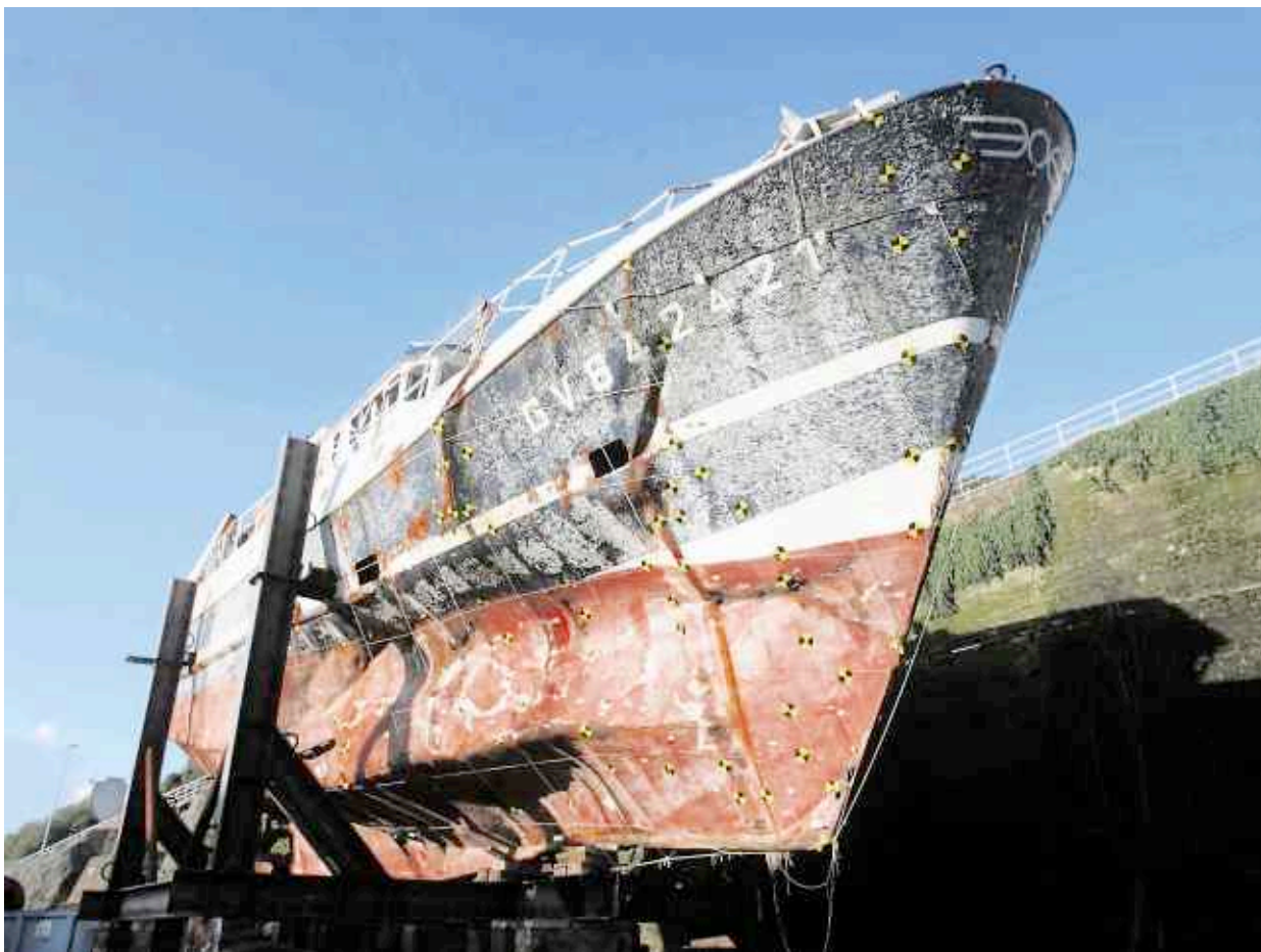
Renflouée, l'épave du Bugaled Breizh a été ramenée à Brest pour expertise.

Une requête d'autant plus importante que le Dolfijn a déclaré se trouver à 8 milles du Bugaled à 12 h 53. « Il faut connaître son trajet, car il pouvait se trouver sur le lieu du naufrage à 12 h 25. Mais sa position à cette heure n'a jamais été donnée ». L'armateur poursuit : « Par ailleurs, la station Culdrose (une base anglaise) a recueilli une information selon laquelle le Dolfijn aurait récupéré deux