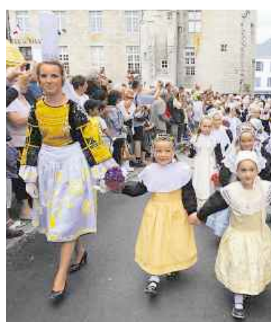
La Fête des Brodeuses à Pont-l'Abbé : un incontournable.